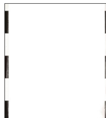
CAPAROL Samtex 3 fedőképessége az első réteget követően