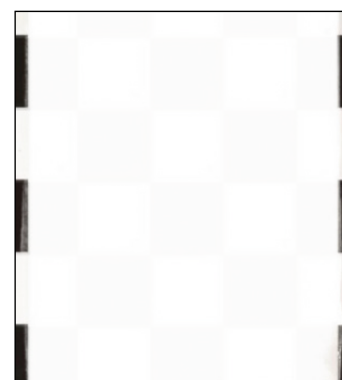
CAPAROL Samtex 3 fedőképessége az első réteget követően